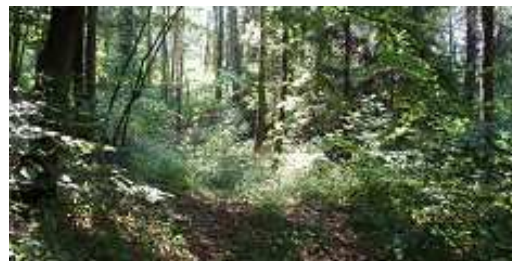
(natürliches Vorkommen der Zecken)

Zecken halten sich in allen Stadien in ihrem natürlichen Habitat am Boden, im Unterholz, an Sträuchern oder Gräsern auf, ehe sie sich wieder einen Wirt für die Blutmahlzeit suchen. Insgesamt dauert der Lebenszyklus einer Zecke zwischen 2 und 4 Jahre.